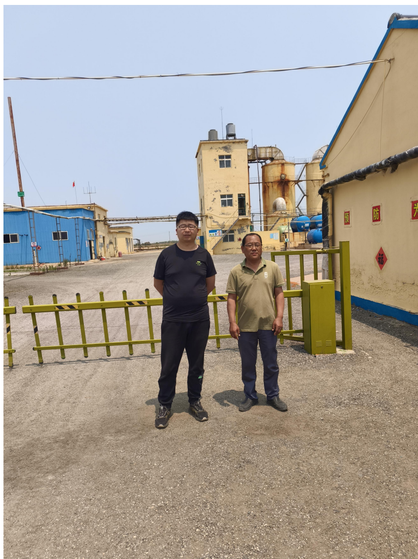
2、合同首页、评价范围页