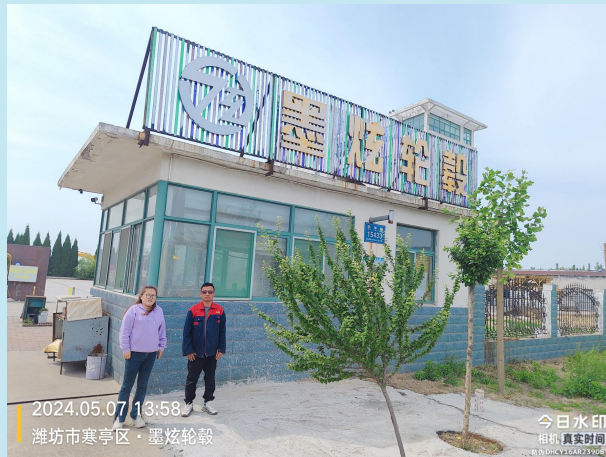
现场采样、现场检测图像影像：