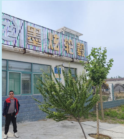
现场调查影响资料：