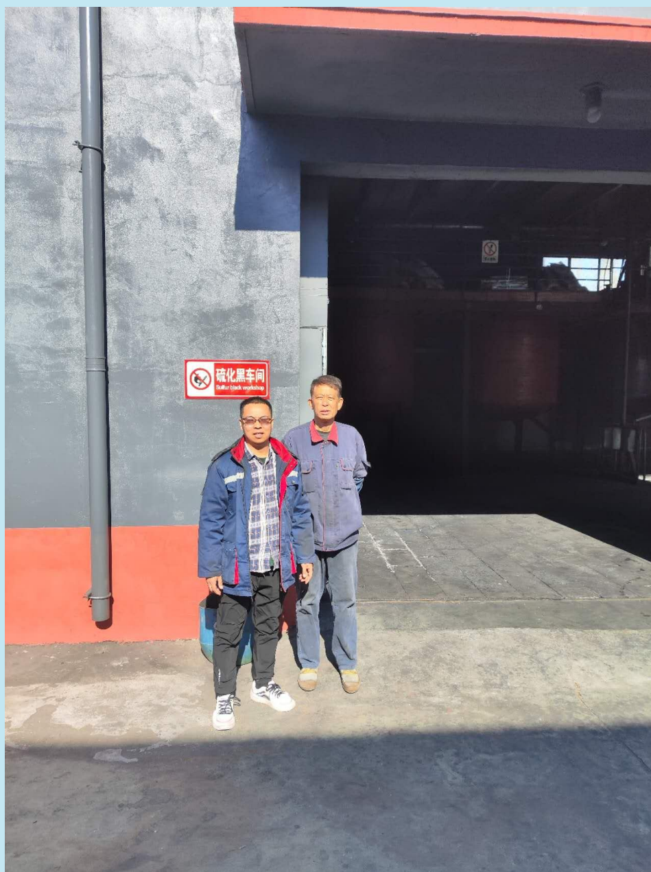
现场采样、现场检测图像影像：