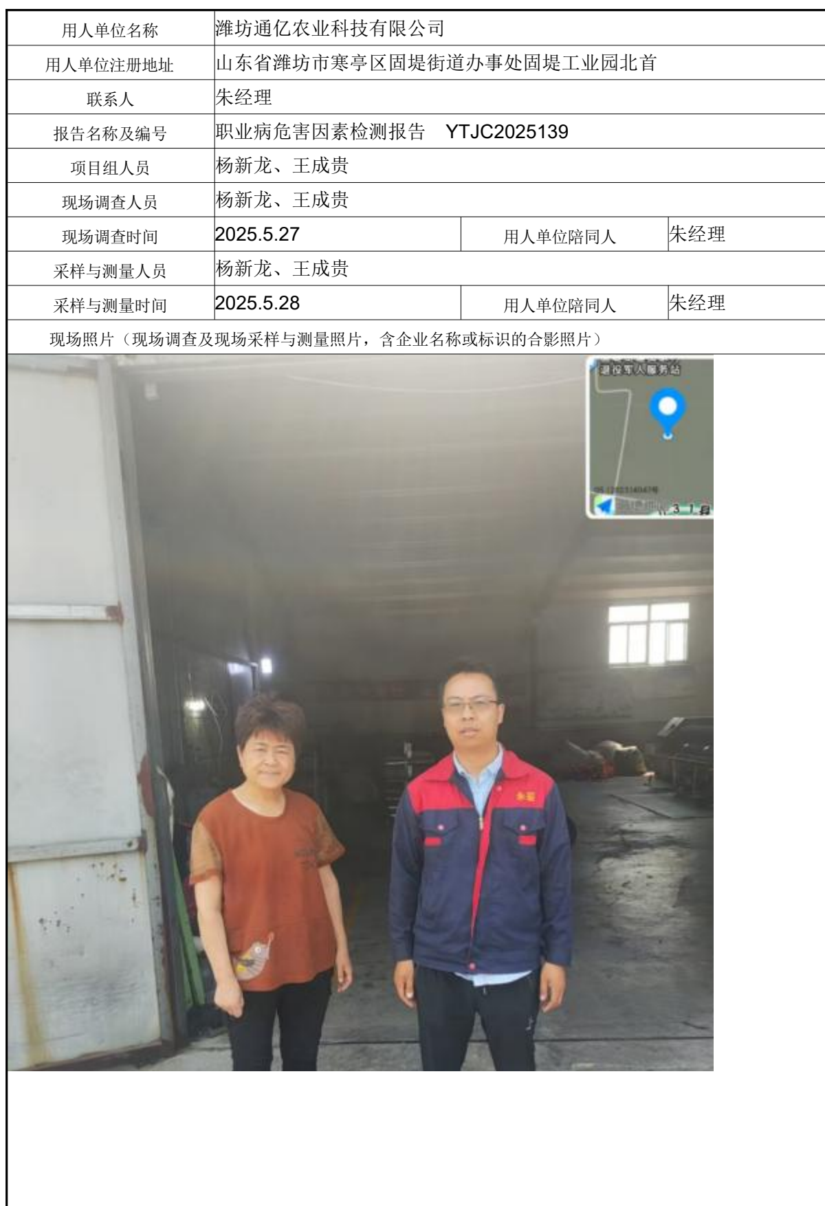
职业卫生技术报告信息网上公开记录表