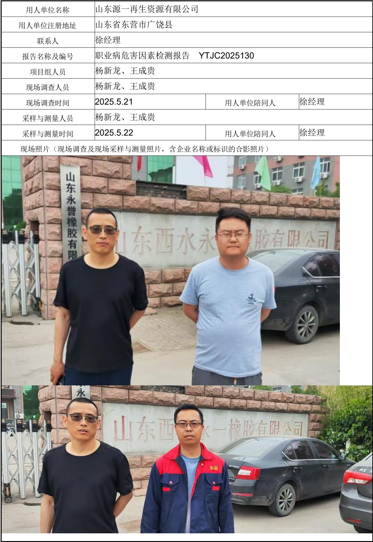
职业卫生技术报告信息网上公开记录表