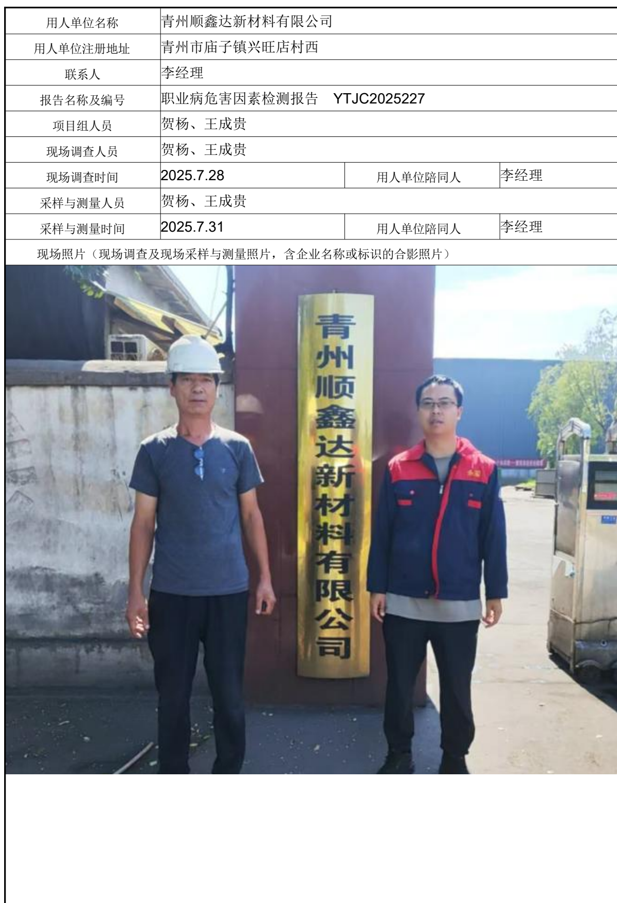
职业卫生技术报告信息网上公开记录表